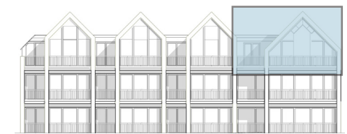
Südansicht (Asbacher Straße)