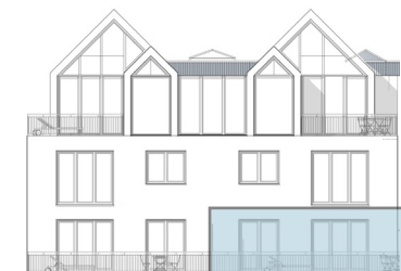
Westansicht (Breite Straße)